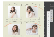
選べる白髪ぼかしPOP